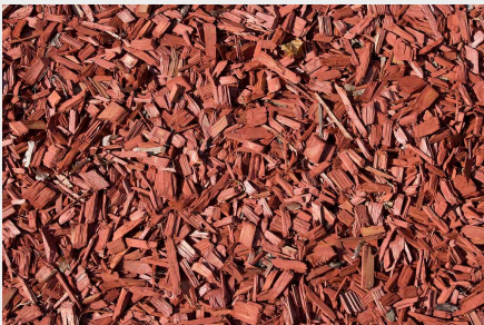
Astillas de madera

El picnómetro de gases BELPYCNO L puede emplearse para medir la densidad de una gran variedad de materiales: polvos, madera, Materiales de construcción, Catalizadores, líquidos y pastas, Carbón activado, alimentos, Productos farmacéuticos, ...y muchos otros.